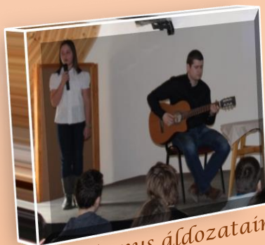
Kommunizmus áldozatainak emléknapja