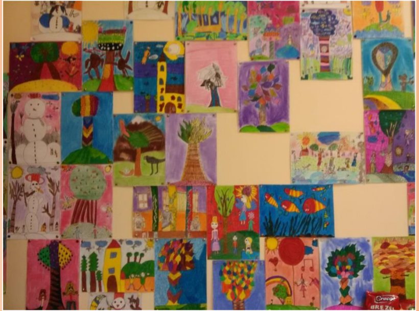
Projektmunka az 5.6 és a 6. osztályba