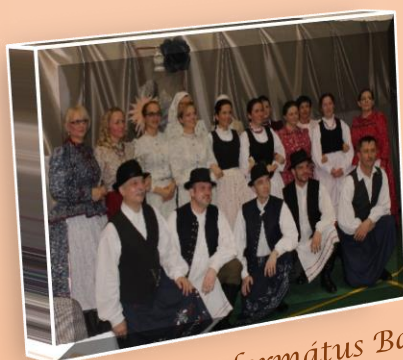
VI. Bihari Református Bál