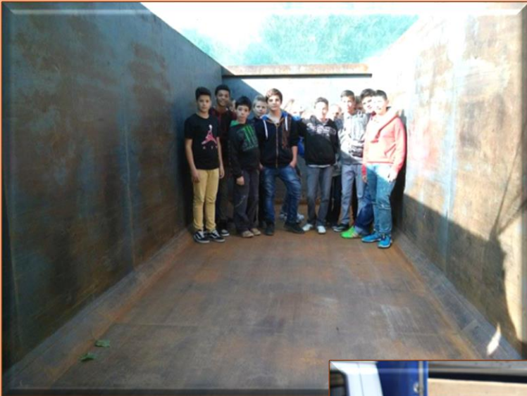
Még üres a konténer.

Gratulálunk nekik, és köszönjük a segítséget a szülőknek, az iskola dolgozóinak és az időjárásnak!