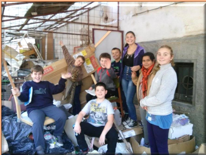
Vidáman dolgoznak, hordják a papírokat.