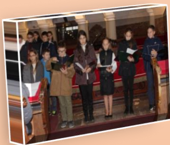
Október 23. ünnepség